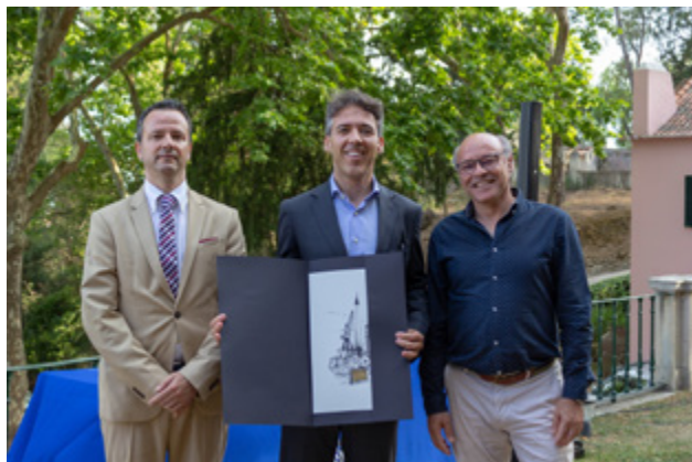
Mérito Empresarial IBEROL

O Dia da Vila do Sobralinho foi assinalado a 4 de junho de 2023, com a celebração dos 26 anos de elevação a vila. Nesta data, os galardoados pela Junta de Freguesia foram: