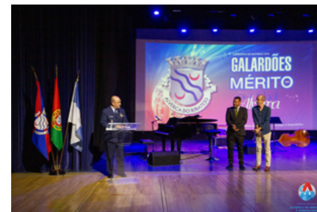
Galardão Cidade de Alverca Depósito Geral de Material da Força Aérea