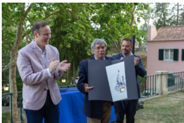
Mérito Autárquico Júlio Pina