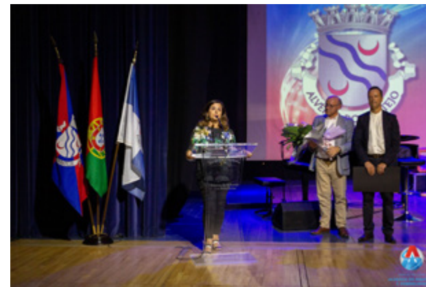
Mérito Empresarial Ómnialab