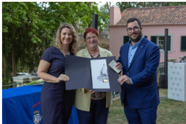
Mérito Cultural UDCAS