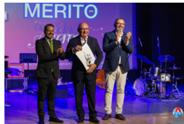
Mérito Autárquico Alberto Mesquita