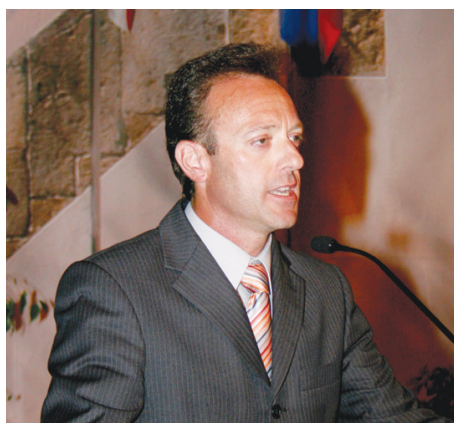
Mérito Social - Igreja Evangélica Assembleia de Deus de Alverca