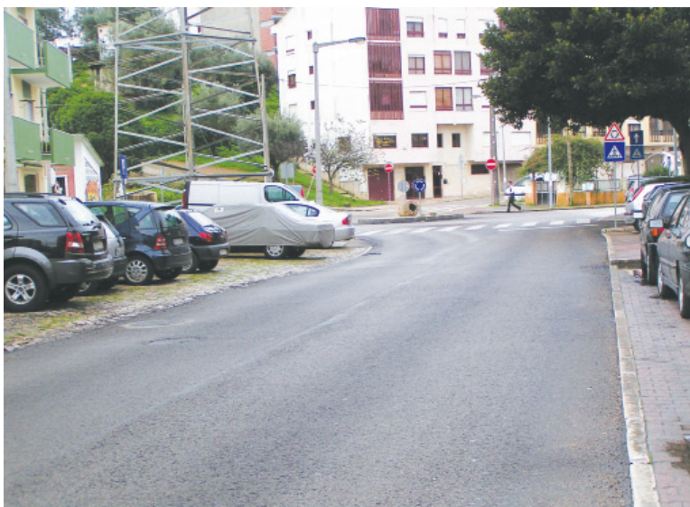
Realizaram-se diversas recargas betuminosas nas ruas da freguesia. Assim aconteceu, por exemplo, no Casal da Bica ou na Rua dos Lavadouros (foto)

Numa cidade de grandes dimensões, como Alverca, onde convivem, diariamente, milhares de pessoas com milhares de veículos, há que fazer um esforço para garantir uma mobilidade segura para as pessoas e permitir uma fluidez normal e rápida dos veículos.