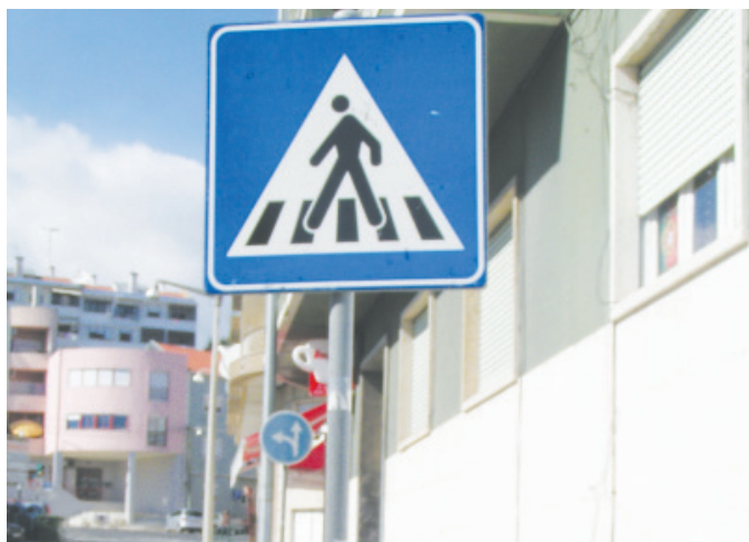
Está a decorrer o registo cadastral dos sinais de trânsito da freguesia. Um trabalho que permitirá, no final, fazer ajustamentos na sinalização vertical. A Junta de Freguesia fez igualmente um investimento superior a 2.500 euros na colocação de "olhos de Gato", em quatro passadeiras de peões