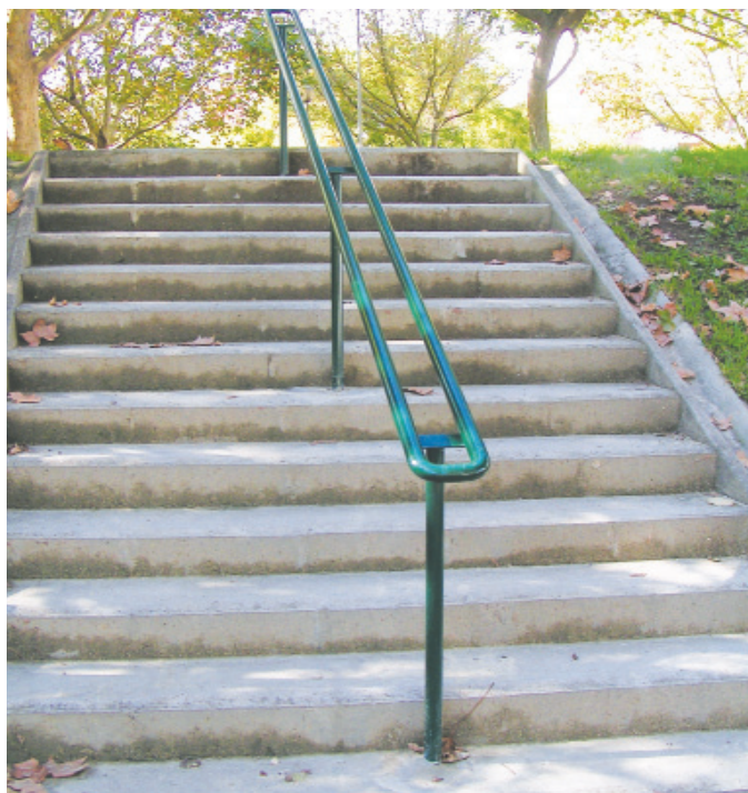
No Jardim José Álvaro Vidal, com o objectivo de melhorar a segurança dos seus frequentadores, foram colocados diversos corrimãos.