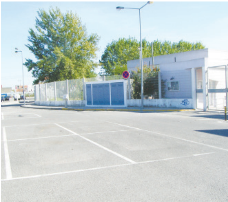
Em frente à escola Pedro Jacques de Magalhães procedeu-se à marcação do parque de estacionamento