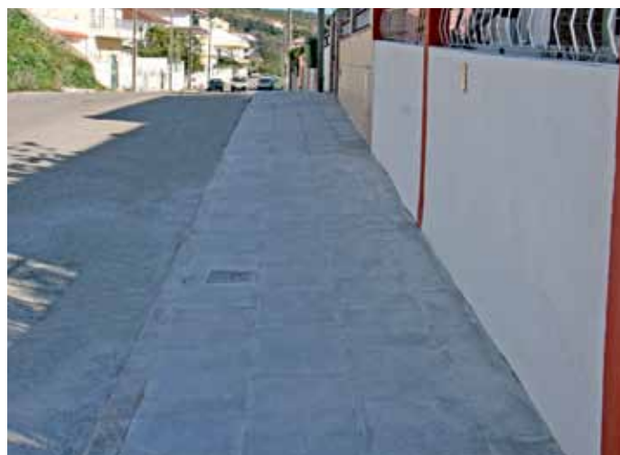
Também o passeio da Rua Ferreira de Castro, em Arcena, sofreu uma primeira fase de recuperação, prevendo-se dar continuidade a esta obra em 2012.