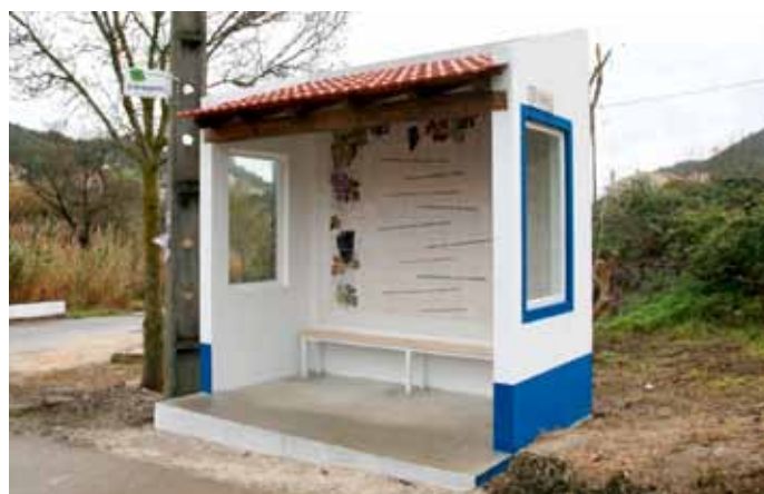
Abrigo de passageiros no Ramal da Calhandriz

Quem passa na EN10 pode ver o novo totem identificativo do cemitério de Alverca.