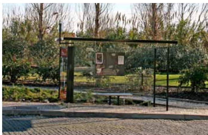
Abrigo de passageiros da Verdelha

No sentido de melhorar as condições de vida aos nossos concidadãos foram criados 2 novos abrigos de passageiros: