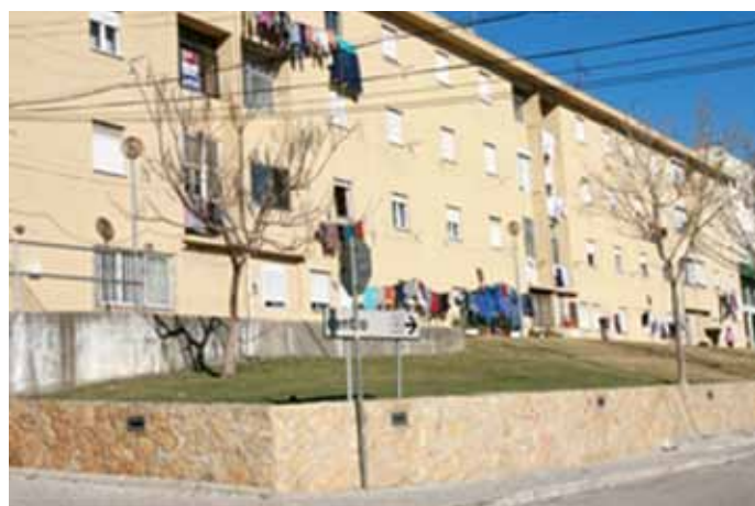
A entrada da Rua António Sérgio, Chasa, foi alvo de requalificação, com capeamento a pedra, do muro de suporte.