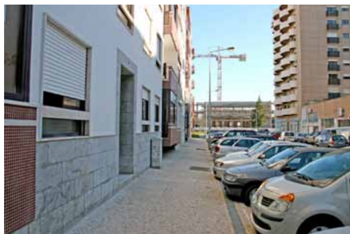
Na Rua da Juventude requalificou-se o passeio.