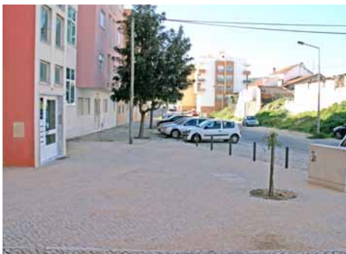
Obra incluída no Orçamento Participativo de 2011, procedeu-se à colocação de calçada no passeio da Rua Ivone Silva, em Arcena.