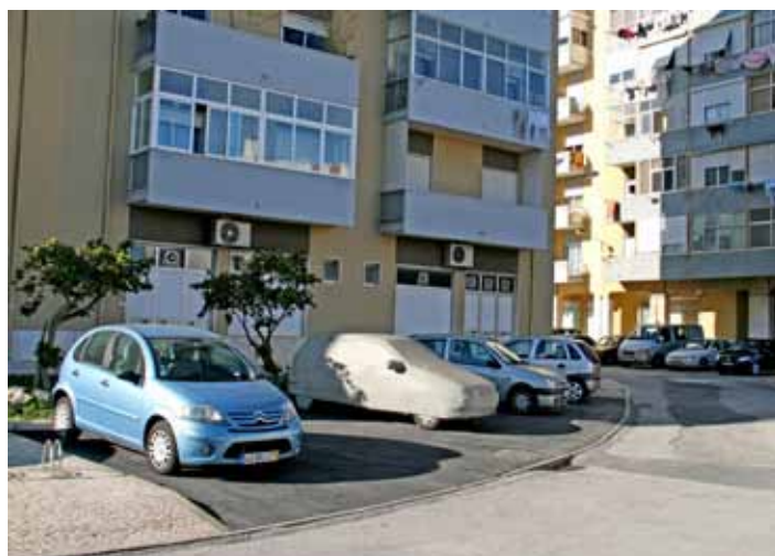
Rua D. João I

Ao longo de toda a cidade foram criadas novas bolsas de estacionamento: