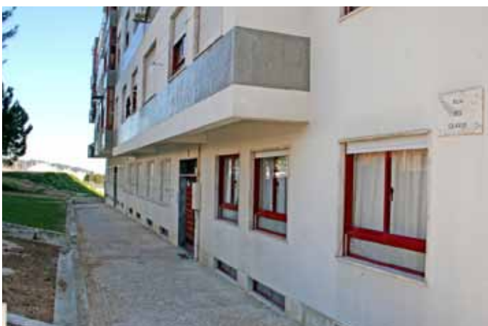
Na Rua dos Cravos, frente ao Centro de Saúde do Bom Sucesso e Arcena, efetuou-se a recuperação do passeio em calçada e reestruturação do escoamento de águas pluviais.