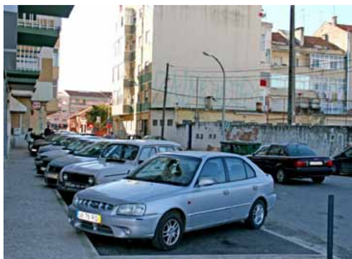
Rua Coronel Henrique Mora