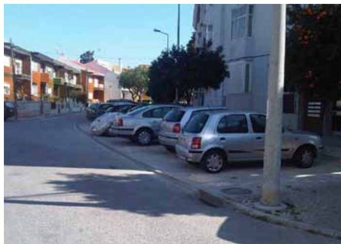
Várzea do Brejo