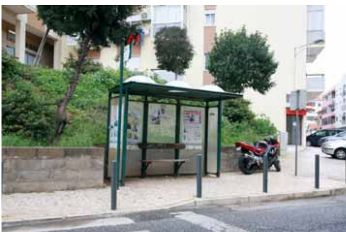
Na Estrada de Arcena, Alto do Moinho de Vento, requalificação de calçada.