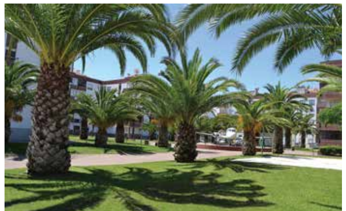
Praceta da Aviação