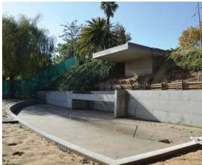
Os lagos do Jardim Municipal José Álvaro Vidal e zona envolvente sofrem melhorias e requalificação