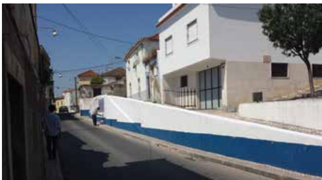
Rua Dr. Miguel Bombarda, importante ponto de passagem na freguesia, com pintura renovada