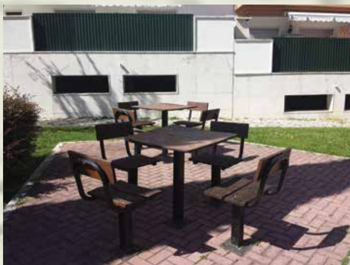
Espaço de lazer junto à sede do Centro Social para o Desenvolvimento do Sobralinho