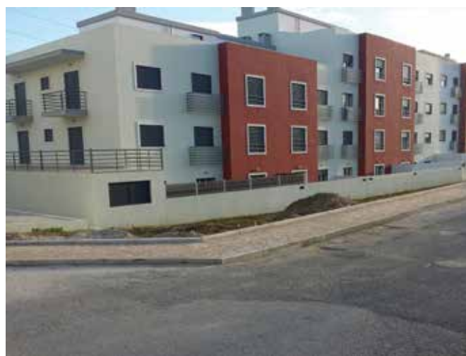
Construção do passeio da Rua da Nora, Sobralinho