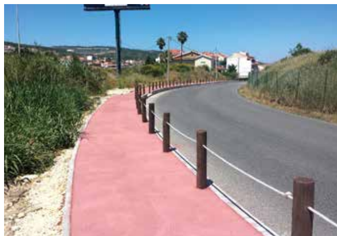
Continuação do Caminho Pedonal na Rua Senhora da Graça