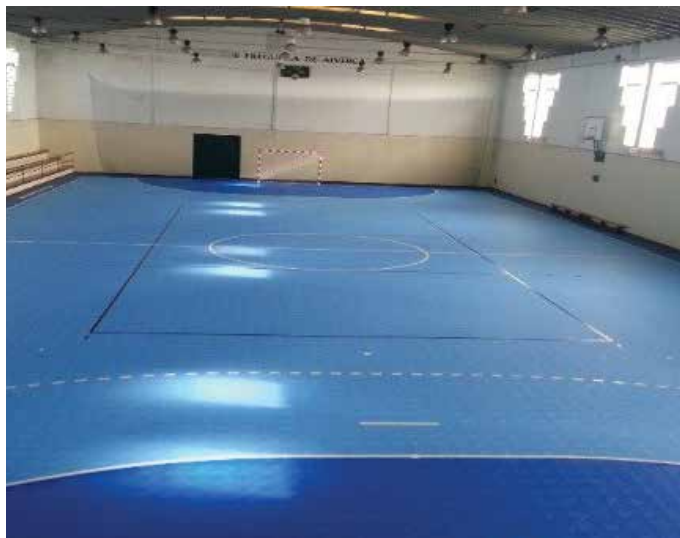
No Desporto, o Pavilhão Municipal recebeu um pavimento novo