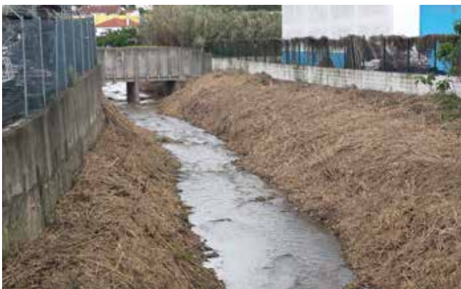
Limpeza da Ribeira das Silveiras