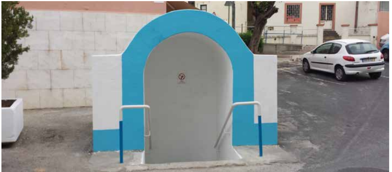
O Fontanário da Vila do Sobralinho recentemente pintado