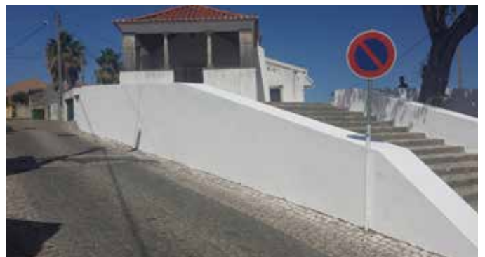
A Capela e Relógio de Arcena sofreram beneficiações, com pinturas exteriores