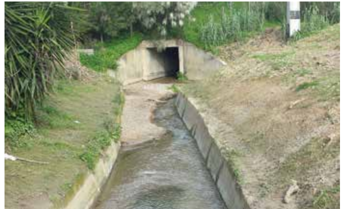
Limpeza da Vala da Verdelha