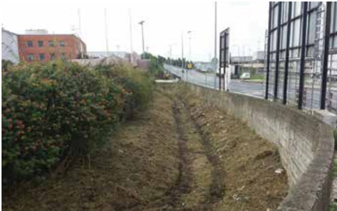
Limpeza da Vala da ex-Nestlé

Desde há alguns anos para cá, Alverca do Ribatejo tem sido considerada uma cidade verde, contando com 252.044,36 m 2 de espaços verdes e com mais de 3700 árvores em meio urbano. A autarquia tem desenvolvido um esforço, em parceria com a Câmara Municipal de Vila Franca de Xira, no sentido de fazer a melhor gestão e planeamento estratégico no que conserve ao Ambiente e Espaços Verdes, não descorrendo a limpeza das linhas de água de forma a garantir a segurança das populações.