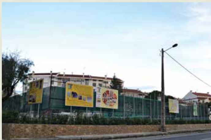
Requalificação da entrada Norte de Alverca