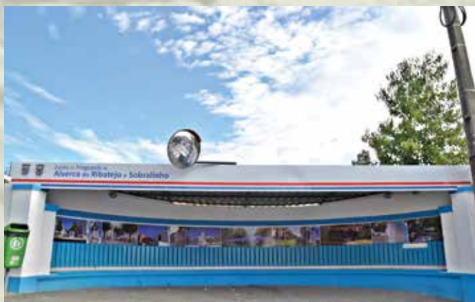
O abrigo de passageiros do Sobralinho, conhecido por “meia laranja”, local de convívio de muitos sobralinhenses, ganhou novo aspeto.