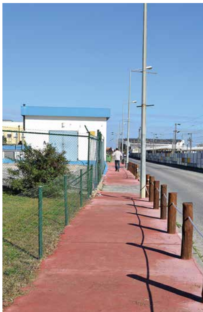
Conclusão do Caminho Pedonal entre a Rua Irene Lisboa e a Rua Engº Vilar Queirós