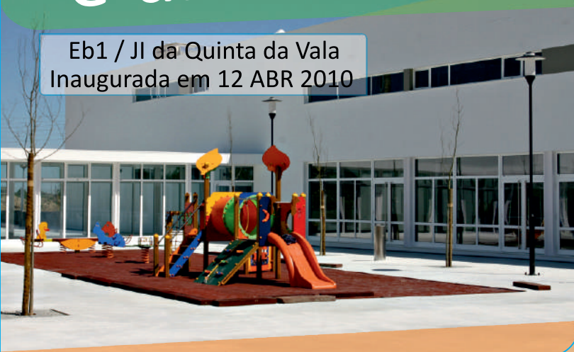
Eb1 / JI da Quinta da Vala Inaugurada em 12 ABR 2010