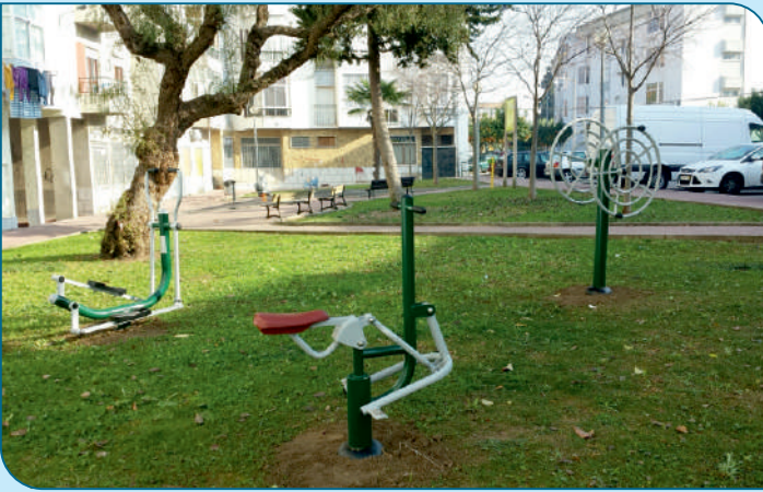
Colocação de equipamento geriátrico no espaço verde da Várzea do Brejo.