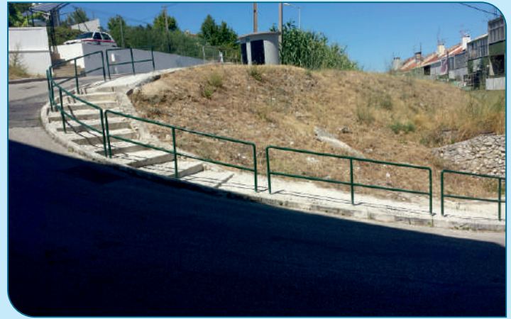
Colocação de corrimão no acesso da Rua Diamantino Freitas Brás à Rua Jorge Maria do Nascimento