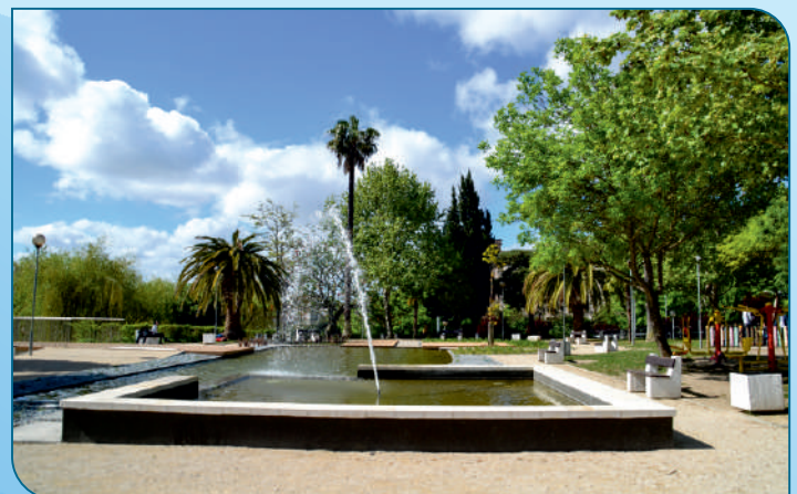
Requalificação dos Lagos do Jardim José Álvaro Vidal no âmbito do O.P. Municipal.