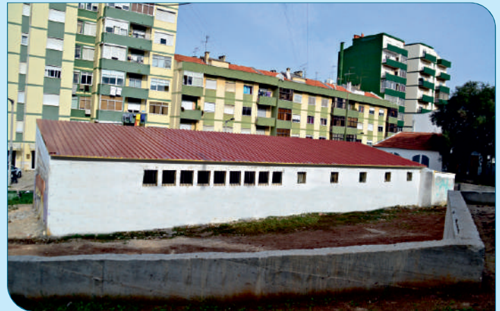
1ª fase de requalificação dos Lavadouros de Alverca e dos espaços envolventes.