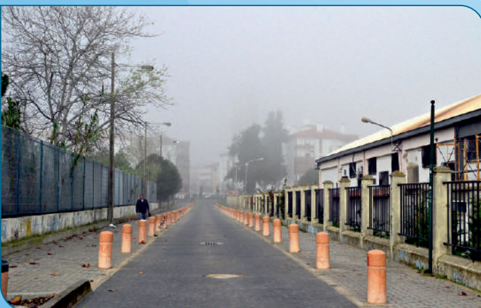
Reabilitação da via central do caminho entre a escola Secundaria de Gago Coutinho e o Centro de Formação Profissional.