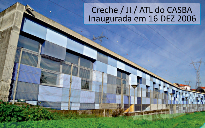
Creche / JI / ATL do CASBA Inaugurada em 16 DEZ 2006