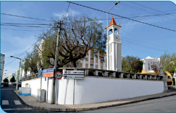
Requalificação e pintura do muro da Torre do Relógio e da Fonte da Rua José Pinheiro no Sobralinho.